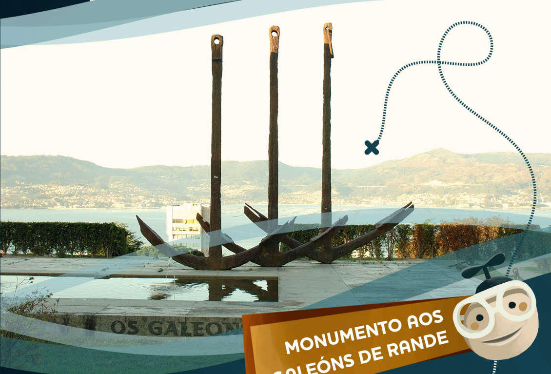
MONUMENTO AOS GALEÓNS DE RANDE