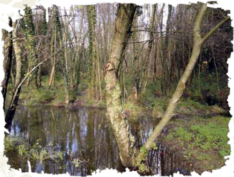
Zona húmida da Bouza / Novocontorno

O municipio de Vigo conta con diversas zonas húmidas de auga doce, que ocupan máis de 200.000 m 2 . As máis representativas son as da Bouza, Muíños e Barreiro, que están en terreos públicos e foron obxecto de traballos de recuperación nos últimos anos. As de Goberna, o Vao e Fontes-Pertegueiras, que están en espazos privados. Entre todas acollen unha importante biodiversidade que é parte do patrimonio natural do Concello de Vigo.